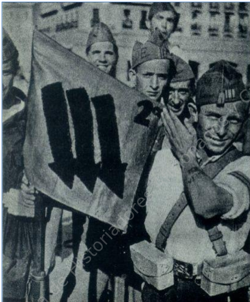
Un sargento de la 2 Cía. de Acero nos muestra el banderín de la unidad.

La influencia político militar del Quinto en el momento de la militarización es máxima, su realismo frente a la situación militar y la superioridad técnica de sus unidades hacen que cuando se decide la formación de seis brigadas mixtas, cuatro de sus comandantes provienen del Quinto, todo un éxito para unas fuerzas que todavía eran muy minoritarias en el frente del Centro.